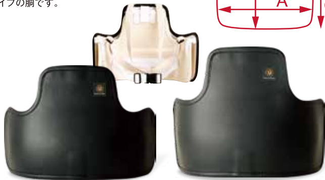
ボディプロテクター黒 M