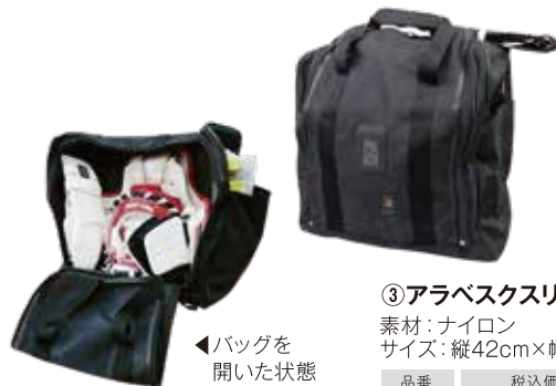
③アラベスクスリーウェイバッグ