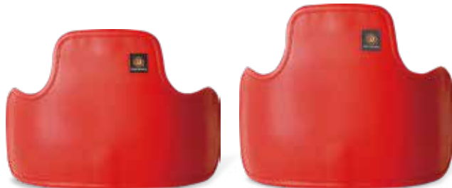
ボディプロテクター赤 M