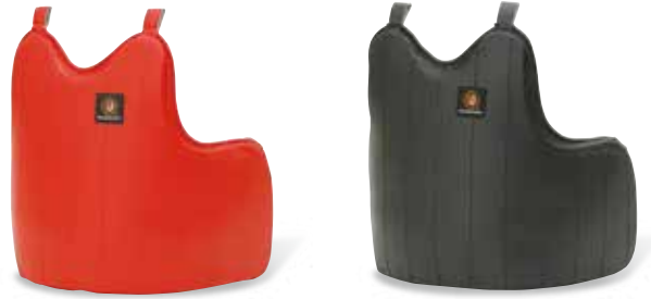
スーパーセーフ 赤胴 子ども用